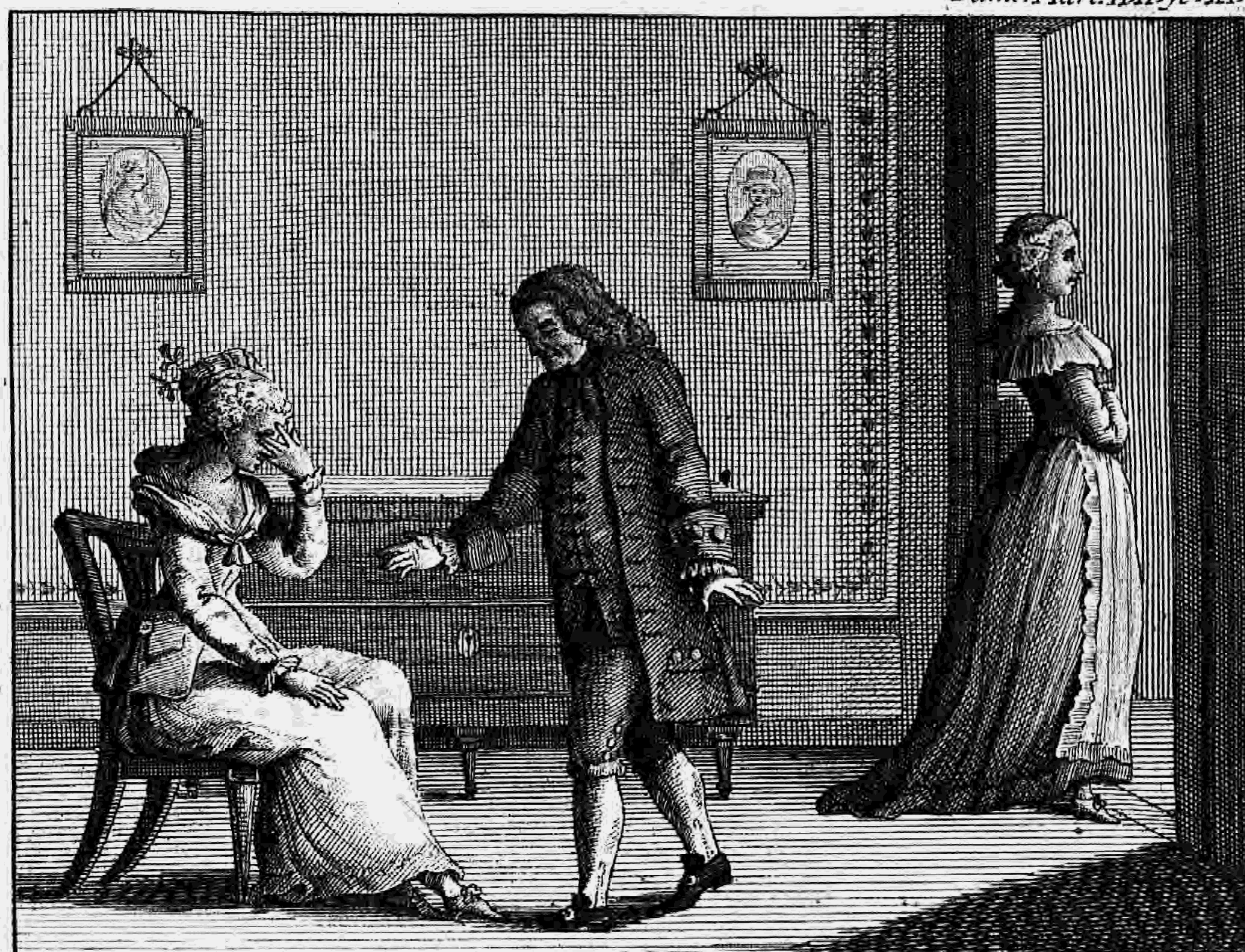
Pietro Ant. Novelli inv.