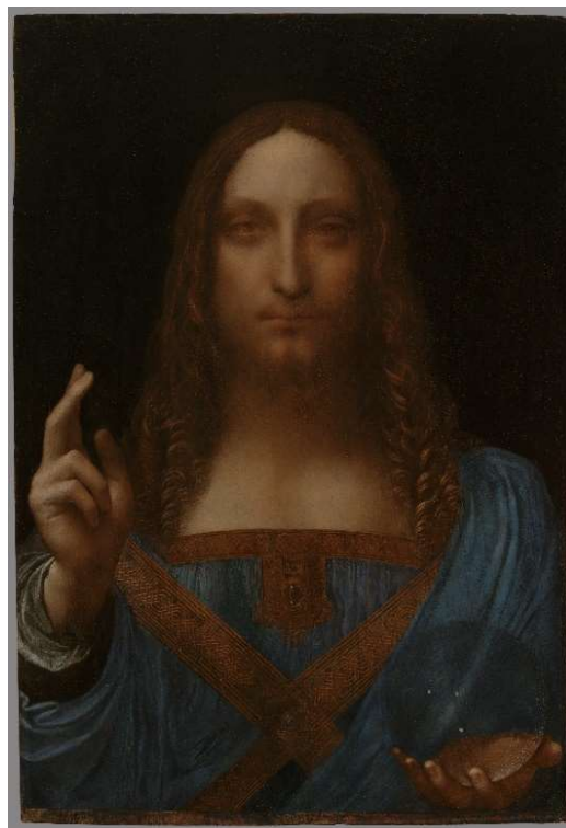
Salvator Mundi , 1499 ca.

Le recenti polemiche sull'acquisto, per un'ingente somma, del Salvator Mundi attribuito a Leonardo da Vinci non dovrebbero incidere sulle considerazioni storiche, qualitative e interpretative di quest'opera, per cui esistono disegni preparatori di Leonardo e che è ricordata nei documenti, a far tempo dal 1525, fino a quelli che la citano come in proprietà del re d'Inghilterra. La conferenza di Pietro Cesare Marani si sofferma sull'iconografia del Salvatore nella pittura bizantina, fiamminga e italiana ponendo in evidenza l'apporto originale del prototipo allestito da Leonardo, l'alta qualità della versione ora riapparsa e la sua fortuna presso i seguaci del maestro.