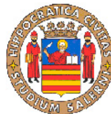
Università degli Studi di Salerno