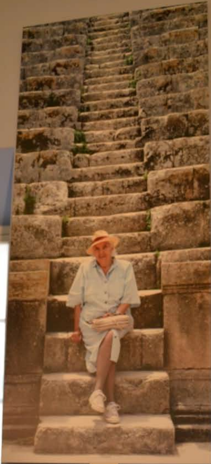
A small, rectangular white label with illegible text, positioned directly below the photograph.